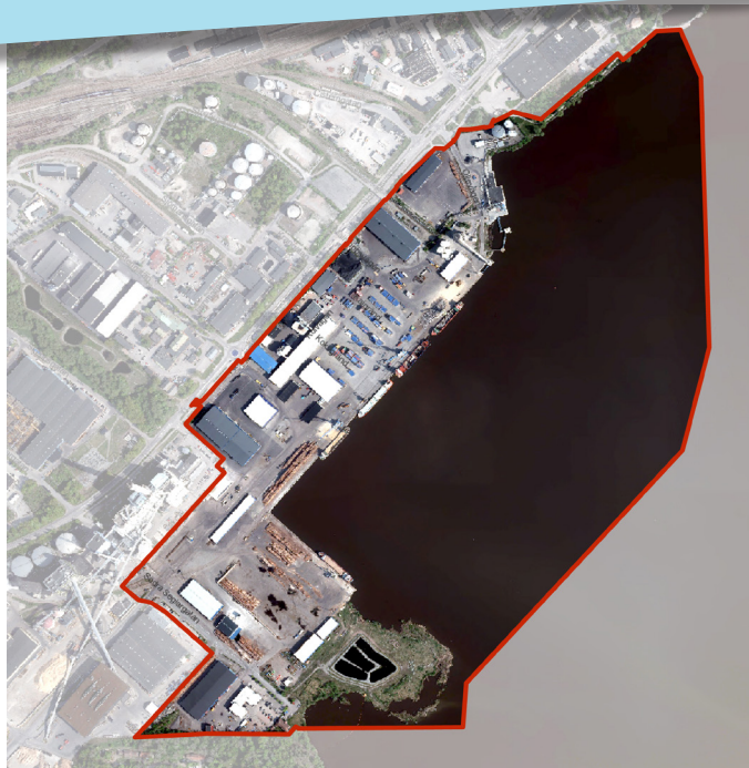
Flygfoto med planområdet är inringat i rött.