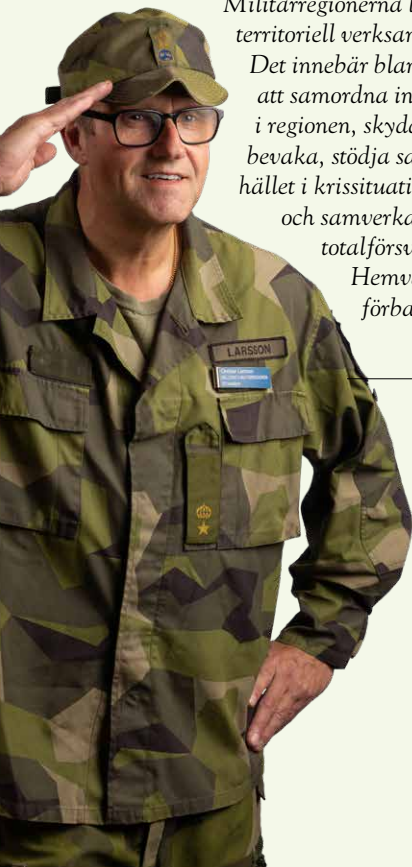
Christer Larsson Hemvärnet

Beredskapskraven på hemvärnsförbanden är 6 – 24 – 90, vilket betyder att delar av förbanden ska påbörja lösandet av uppgifter inom sex timmar och huvuddelen av förbanden ska påbörja lösandet av uppgifter inom 24 timmar. Förbanden ska ha minst 90 dagars uthållighet. Hemvärnssoldaterna har både civil och militär kompetens och stor lokalkännedom.