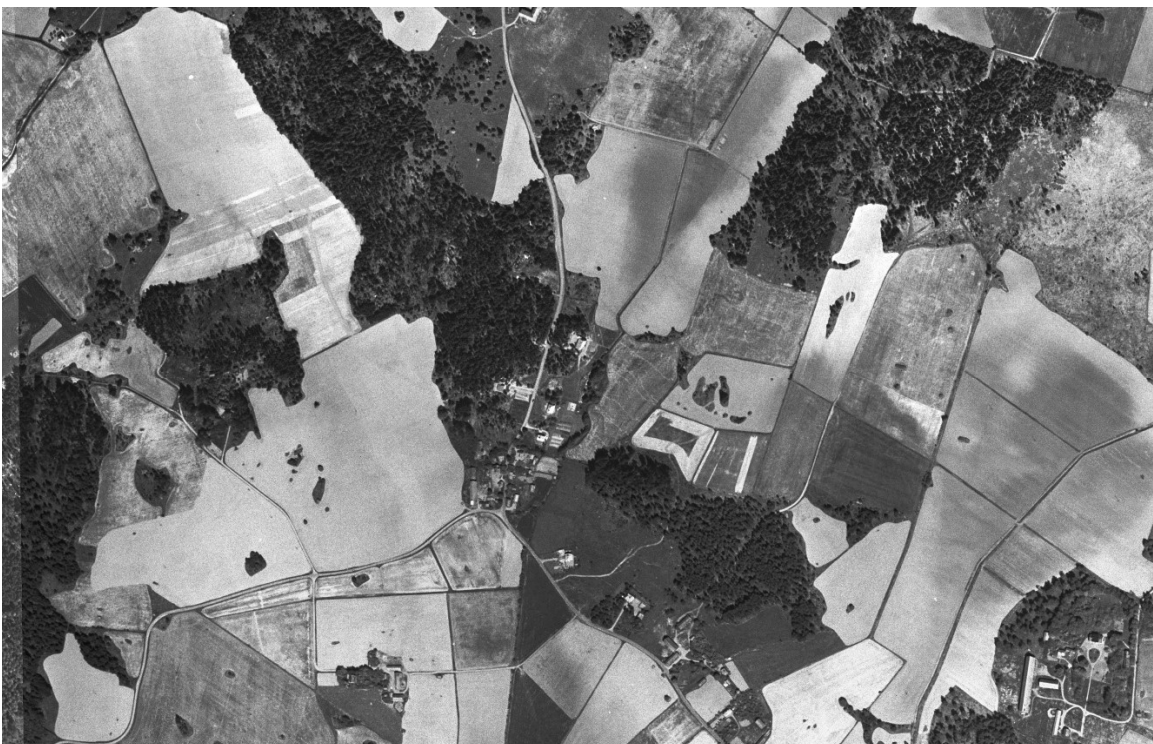
Historiskt ortofoto ca 1960