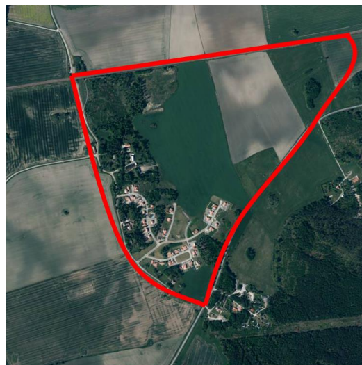
Figur 3-1 Skiss över området som visar triangeln av stora barriärer.

En risk för barns rörelsefrihet är att området redan idag är omgärdat av större barriär så som järnvägen i norr, väg 706 i väster och väg 692 öster om området. Dessa barriärer gör att barn är begränsade till ett område, format som en triangel, se Figur 3-1. Idag finns det inga målpunkter direkt utanför denna triangel som barn skulle behöva ta sig till på egen hand men om utveckling fortsätter behöver förbindelser som övergångsställen samt broar eller tunnlar utredas.