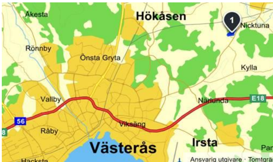
Figur 1-1 Kartan visar planområdet markerat med nr 1, i förhållandet till Västerås tätort.

2019 beslutade Västerås stad att ta fram en detaljplan för ett nytt bostadsområde i Mycklinge. Detaljplanområdet ligger cirka 10 kilometers från Västerås centrum i anslutning till väg 692, se planområdet markerat i Figur 1-1. Planförslaget för området omfattar bostäder, friliggande småhus och radhus, samt en ny förskola. I planförslaget rekommenderas att bebyggelsen ska anpassas till befintligt småhusområde, Abergas By, som kan beskrivas som glest och småskaligt med landsbygdskaraktär.