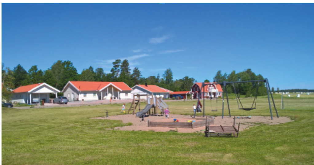
Byggaktörens foto av några småhus i första etappen