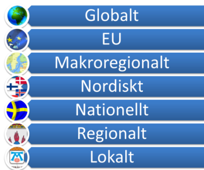
Figur 3. Västerås stad tar hänsyn till olika nivåer som berörs i internationella samarbeten.