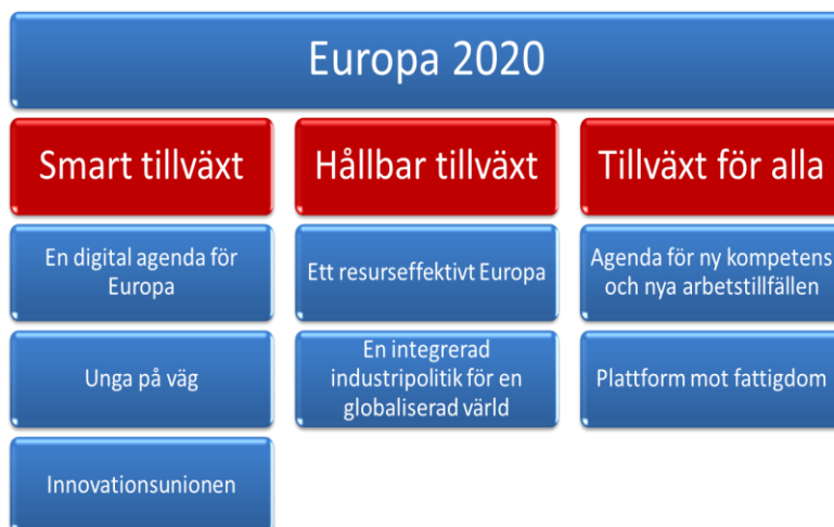
Figur 1. Europa 2020-strategins prioriterade områden och sju huvudinitiativ.

Sju huvudinitiativ, så kallade flaggskeppsinitiativ har tagits fram inom prioriteringarna. De nationella resultaten följs upp årligen och synliggörs inom EU och nationellt.