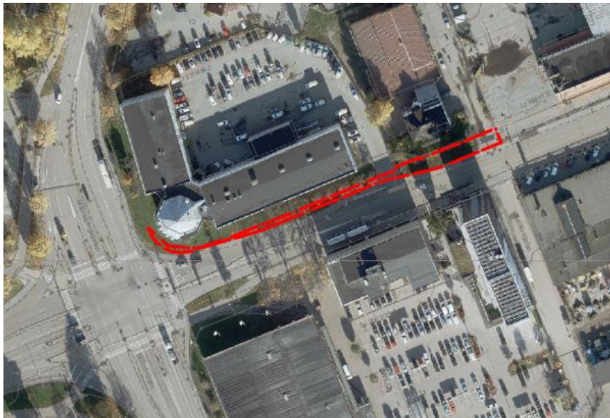
Bild över planområdet

För att använda mark- och vattenområden till de ändamål som de är mest lämpade för, planlägger kommunen dessa områden i en detaljplan. Lämpligheten bedöms med hänsyn till egenskap, läge och behov. När kommunen tar fram en detaljplan görs det efter en process för att säkra insyn för berörda fastighetsägare och kommunala förvaltningar, för att få fram ett så bra beslutsunderlag som möjligt och för att förankra förslaget.