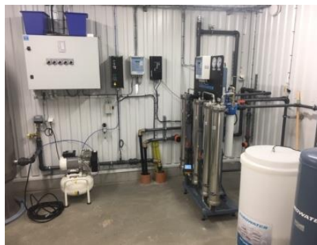
Figur 3. Vattenverk vid Skästa Hage, ut- och invändigt.